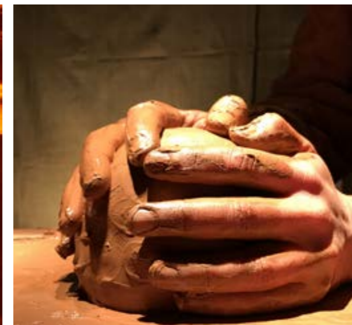
détails de la transformation de la matière argile durant le spectacle- janvier 2021 TJP Strasbourg