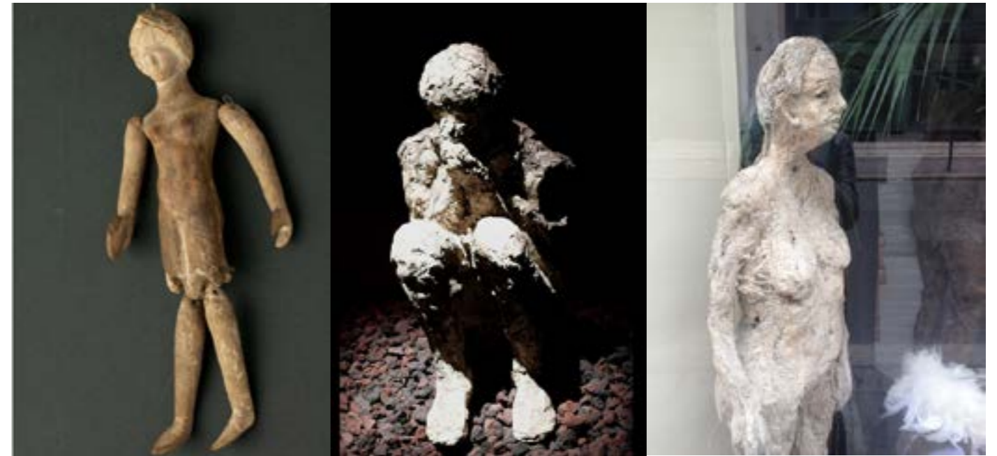
marionnette de type tanagra, Sicile Antiquité (Vème ou VIème siècle) NB: plus ancienne marionnette trouvée et conservée à ce jour collection Jacques Chesnais - Portail des Arts de la Marionnette