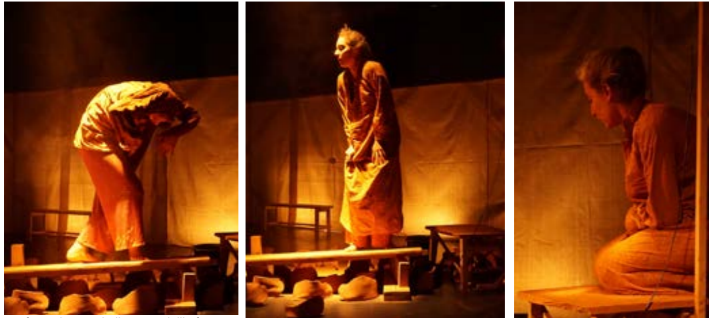
transformation symbolique en vieille femme - création sans public TJP Strasbourg - janvier 2021

Le spectacle étant destiné aux tout-petits, ces inspirations nourriront la recherche en sous couches, tout en restant traité de façon ludique et légère à la destination du public concerné.