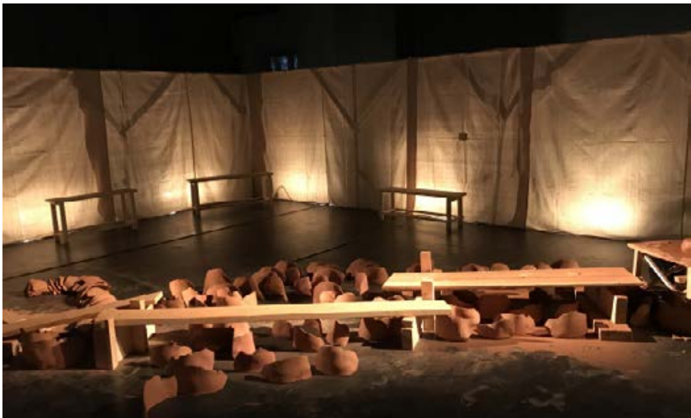
RIDE - parcours à la fin de la traversée - TJP janvier 2021