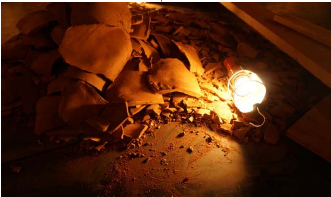
argile rouge desséchée et craquelée - dispositif archéologique du spectacle - cie juste après janvier 2021

cie juste après - création 2021 - production déléguée au TJP Centre Dramatique National de Strasbourg - dossier mis à jour en avril 2021 -