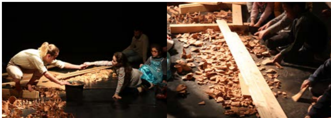
rencontre au plateau avec un groupe d'enfants dans le cadre de notre résidence au Théâtre Dunois, Paris - février 2020