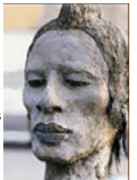
Ousmane Sow - visage