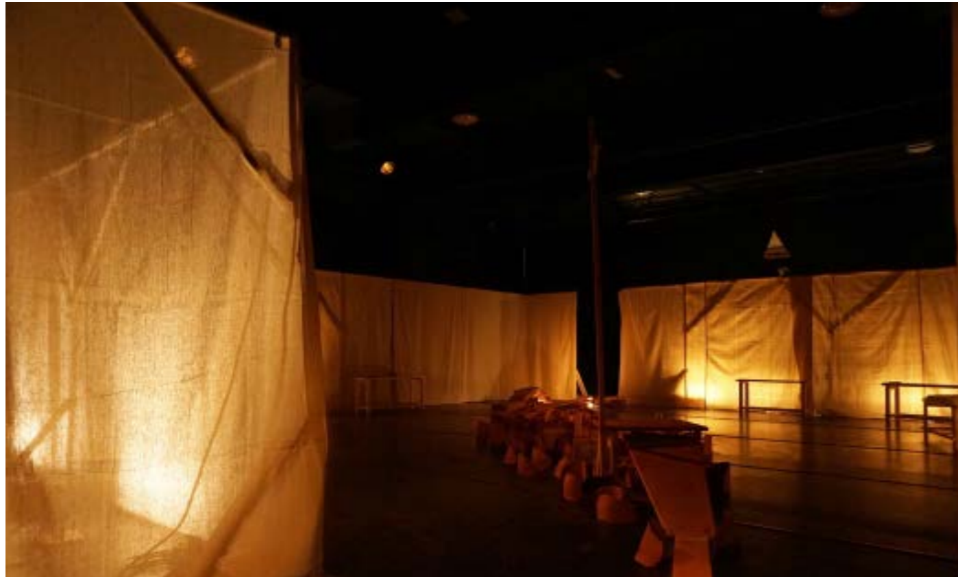
scénographie Olivier Thomas - création au TJP de Strasbourg, janvier 2021

Ce dispositif à la fois sonore et lumineux va poétiser l'espace afin d'emmener les jeunes spectateurs/trices dans un tout autre espace plus métaphorique. Passer de la fouille concrète à un espace plus onirique, celui du rêve, de l'au-delà... pour aussi les emmener dans l'espace de jeu / du jeu, où ils pourront inter-agir avec la matière.